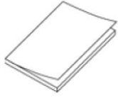
Quick Start Guide (× 1)