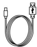
Type-C Cable (×1)