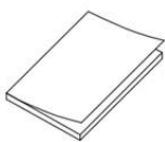
Quick Start Guide(×1)