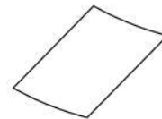
Paño (x 1)