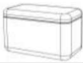
Bolsa (x 1)